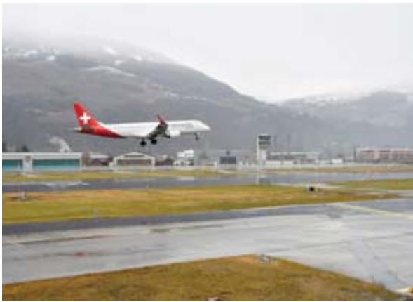
TIMING Le premier vol de la nouvelle liaison Londres - Sion a atterri avec une quinzaine de minutes de retard.