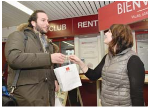
ACCUEIL Tous les voyageurs se sont vu remettre un «Welcome Bag» contenant des produits du terroir valaisan.