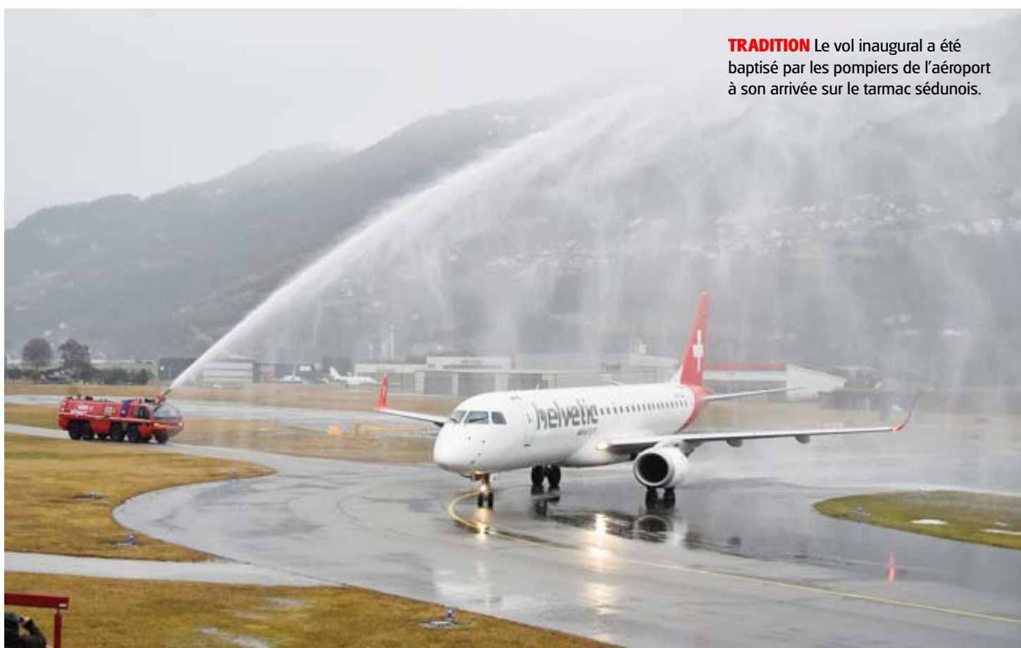
TRADITION Le vol inaugural a été baptisé par les pompiers de l'aéroport à son arrivée sur le tarmac sédunois.

Pour ce vol inaugural, l'appareil, un Embraer 190 pouvant contenir une centaine de personnes, était un peu plus qu'à