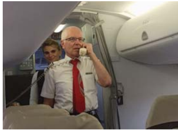
VACANCES Le commandant de bord a souhaité un bon séjour aux passagers de ce premier vol. WALLISER BOTE